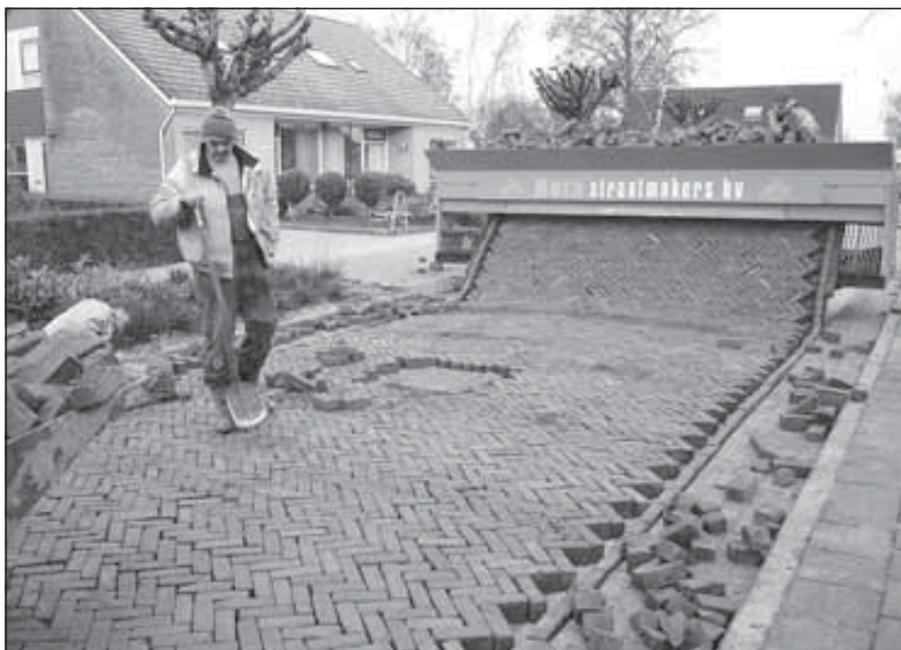
De nieuwe manier van straten aan de Aakweg in Makkum.