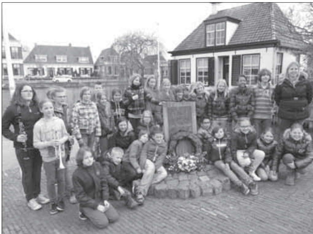
Groepsfoto kranslegging 7 april 2014 monument Vallaat door kinderen Sint Martinusschool.