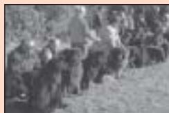
5 Familie koning organiseerde reünie van New Foundlanders