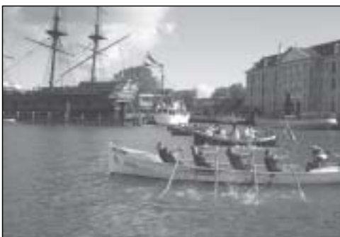
* Op de voorgrond roeisloep Twirre uit Makkum

Amsterdam - Afgelopen zaterdag werd in Amsterdam door 124 sloepen de Grachtentocht geroeid. Vanuit Makkum namen de Brûzer, de Zeesteeg en de Twirre deel aan deze 24,5 km lange klassieker. Er werd gestart bij het Scheepvaartmuseum en om de vijf minuten voeren er vier sloepen het IJ op. Via het Amsterdam-Rijn en het Lozingskanaal kwamen de roeiers de Amstel op waar ze het Olympisch stadion passeerden. Tot zo ver waren de wateren breed genoeg om elkaar goed