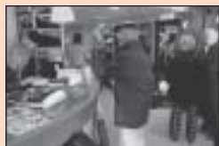
4 Nieuwe herfst-collectie bij Zilt op de Markt in Makkum