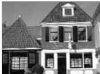
* LMV-Makelaardij Gros te Makkum

Steeds meer willen mensen een tweede woning; een trend die alsmaar toeneemt. In samenwerking met Makelaardij GROS besteedt 'Van Kavel Tot Kasteel' daarom aandacht aan een bijzondere recreatievilla in Makkum in Zee.