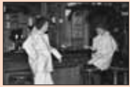
Humor en drama yn ien stik