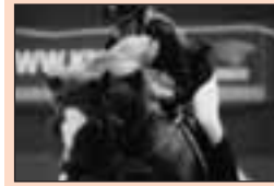
Zusjes Leeuwen Fries kampioen springen