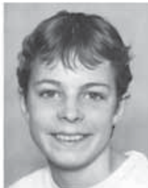
Het is echt waar, deze jonge knaap word 9 februari 40 jaar