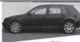
Vw Golf 1.6 benzine

Bouwjahr: 1998 KM: 167000 km Kleur: Zwart Benzine