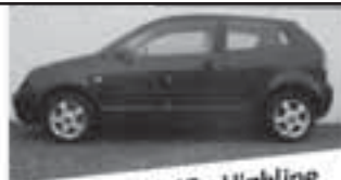
VW Polo 1.4 16v Highline

Bouwjahr: 2002 KM: 115000 km Kleur: Paars Benzine