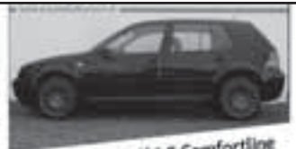
Volkswagen Golf 1.6 Comfortline

Bouwjahr: 1998 KM: 160743 km Kleur: Blauw / paars Benzine