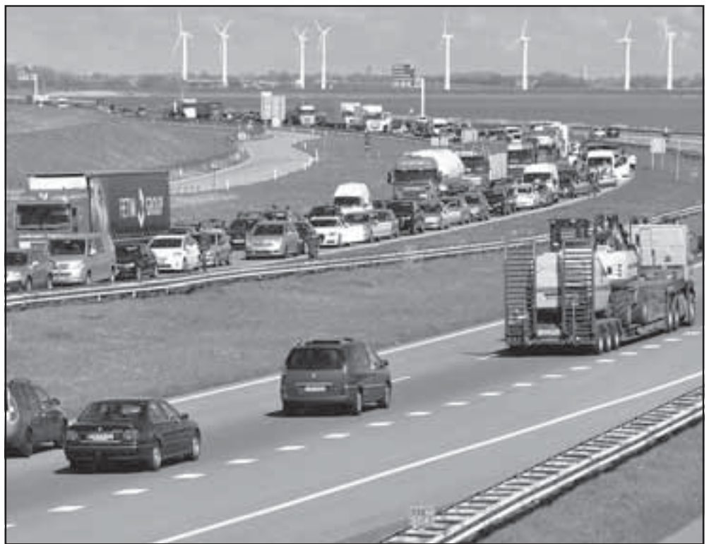
Don Quichot, de vereniging tegen windmolens in het IJsselmeer, had geregeld dat vrijdagmiddag de auto's 26 minuten stil stonden op de afsluitdijk.