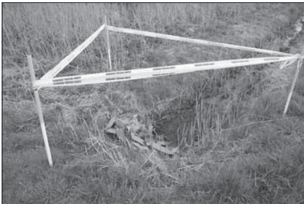
Zoiets mag natuurlijk niet !!! Illegaal asbest storten in een greppel aan de Engwierderlaan.