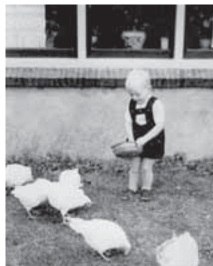
It is wier, dit jonkje wurd 70 jier

Mail naar: advertentie@makkumberbelboei.nl