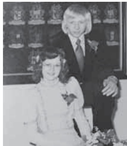
Lokwinske bern en lyts bern